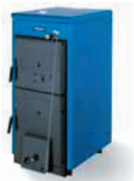
Logano G211 može se dobiti u pet veličina učinaka

Čime se odlikuje robusan kotao Logano G211. Može se bez problema uklopiti u vašu postojeću instalaciju grijanja i lako instalirati. Veliki i lako dostupan prostor za punjenje i ložišni prostor, pojednostavljuje i čini udobnijim rukovanje. Lijevani kotao Logano G211 ne izgleda samo robusan. On ispunjava ono što je obećao – ugodnu toplinu, zimu za zimom.